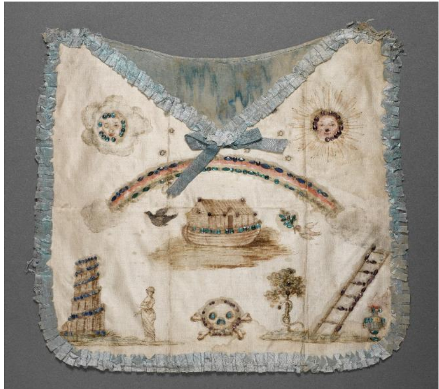
Péreau, G-L. (Abbé), L'ordre des francs-maçons trahis et Le secret des Mopses révélé , 1778, in-12, n.c., éd. Amsterdam, UMONS, Bibl. centrale, Bibl. particulières, Fonds Defuisseaux © UMONS. En Schootsvel met vrijmetselaarsmotief voor dames , 18 e eeuw, zijde - strass, Belgisch museum voor de vrijmetselarij, Brussel © Belgisch museum voor de vrijmetselarij.