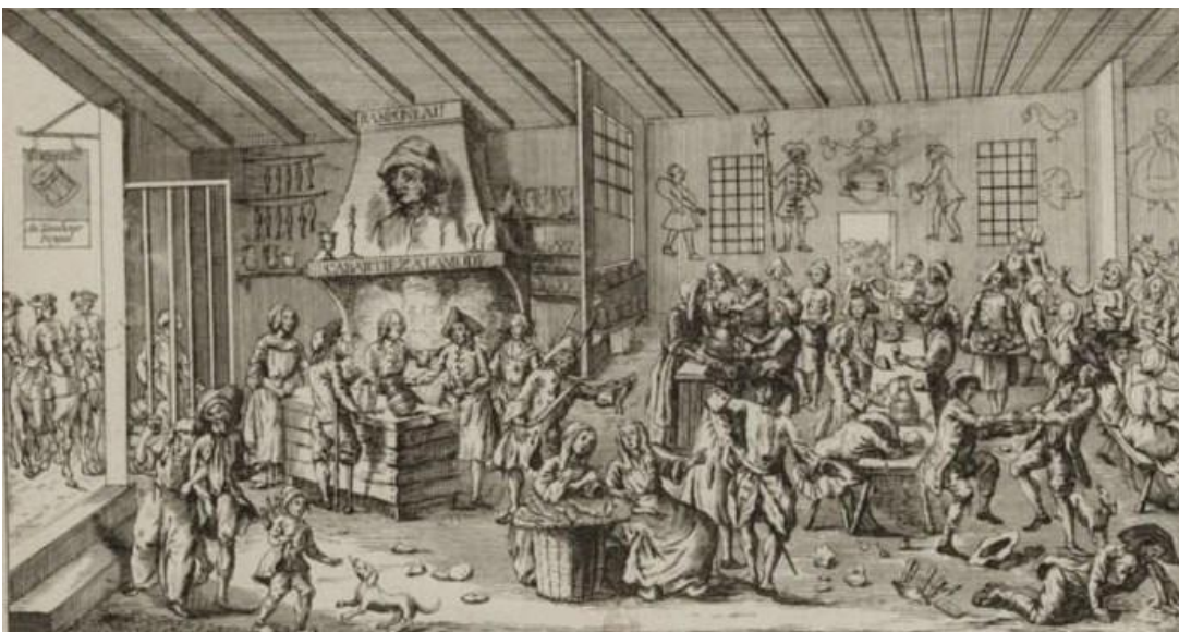
Anoniem, Het cabaret van Ramponeau , rond 1761, 18e eeuw

Omstreeks het midden van de 18de eeuw werd de vrijmetselarij duurzaam verankerd in de Oostenrijkse Nederlanden en bood ze met succes het hoofd aan politieke spanningen, religieuze druk en machtsomwentelingen. Het onderstaande chronologische overzicht toont hoe de vrijmetselarij zich uitbreidde, wie de beweging aanstuurde of bestreed en welke invloed ze heeft uitgeoefend op het intellectuele en maatschappelijke leven van die tijd.