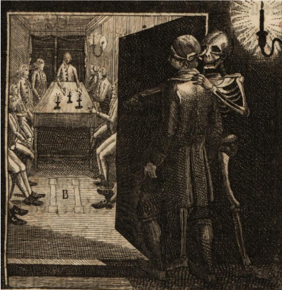
J.-G. Mansfeld (naar een werk van J.-R. Schellenberg), Het skelet van de dood begeleidt een kandidaat bij het inwijdingsritueel , 18 e eeuw, gravure

In de 18de eeuw was de vrijmetselaarstempel een symbolische plek. Hij belichaamde een zoektocht naar zingeving, die tegelijk paste in de erfenis van de antieke tradities en in de verlichte waarden. Zijn architectuur en zijn inrichting weerspiegelden een ritueel waarin elk detail zijn betekenis had.