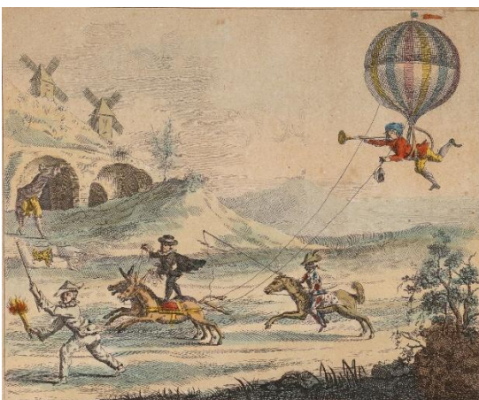
Moyen infallible de diriger les Ballons, 18 e eeuw, ingekleurde gravure, Domaine de Seneffe ASBL

Van de Aarde tot de sterren, van meetinstrumenten tot experimenten met elektriciteit, het wetenschappelijk universum van de loges verenigde cartografen, astronomen, dokters, chemici, wiskundigen en kunstenaars, die zich allen engageerden voor eenzelfde onderneming: de wereld begrijpen om hem beter te kunnen “opbouwen” en hem te ‘verheffen”. (M.H )