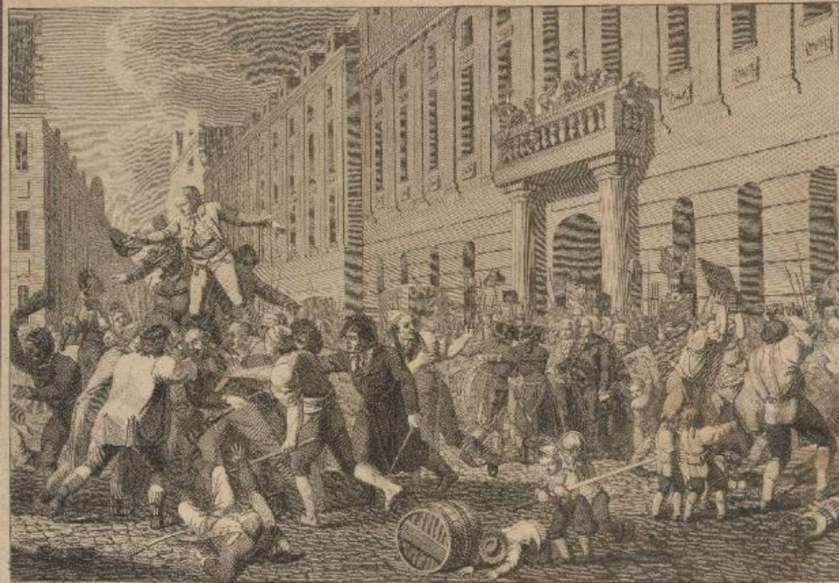
Weber J.J., Révolution de Liège -Émeute populaire devant l'hôtel de ville , 18 e eeuw, gravure, ULG-coll. patrimoniales © Alamy.

Na de revoluties verlieten talrijke vrijmetselaars de loges en maakten plaats voor liberale elites die maar al te graag wilden breken met de traditionele mondaine codes. In de 18de eeuw gaf de vrijmetselarij de voorkeur aan een informele en filosofische arbeid, die gericht was op intellectuele debatten en de uitwisseling van ideeën. In de 19de eeuw veranderen de loges in ruimten die werden bezocht door geëngageerde groepen met een sociabiliteit die gesteund was op invloedrijke relaties en politieke kringen. Daarnaast oefenden ze ook filantropische activiteiten uit.