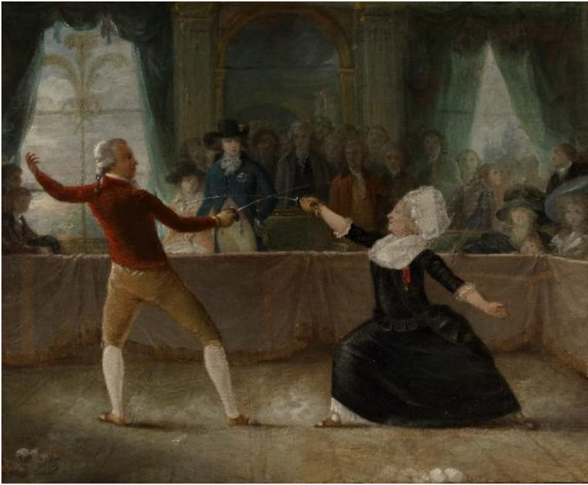
Robineau A.-A., Het schermduet tussen de ridder Saint-Georges en de ridder d'Éon , 18 e eeuw, olieverf op doek, Royal collection Trust © Sa Majesté Charles III, 2025 / Bridgeman Images.

Jachtpartijen, adellijke spellen, golfterreinen of schermwedstrijden: de vrijmetselaars dompelden zich volledig onder in de levenskunst van de elites van de 18de eeuw. Voor de adel en de hoge burgerij werden die zowel fysieke als mondaine activiteiten terreinen voor de uitwisseling van ideeën en nieuwe invloeden. Die hoogtepunten van verfijnde sociabiliteit vonden vaak een voortzetting in weelderige banketten, die werden georganiseerd volgens een streng protocol in een decor waar uniformen en codes betekenisdragers waren. (M.H)