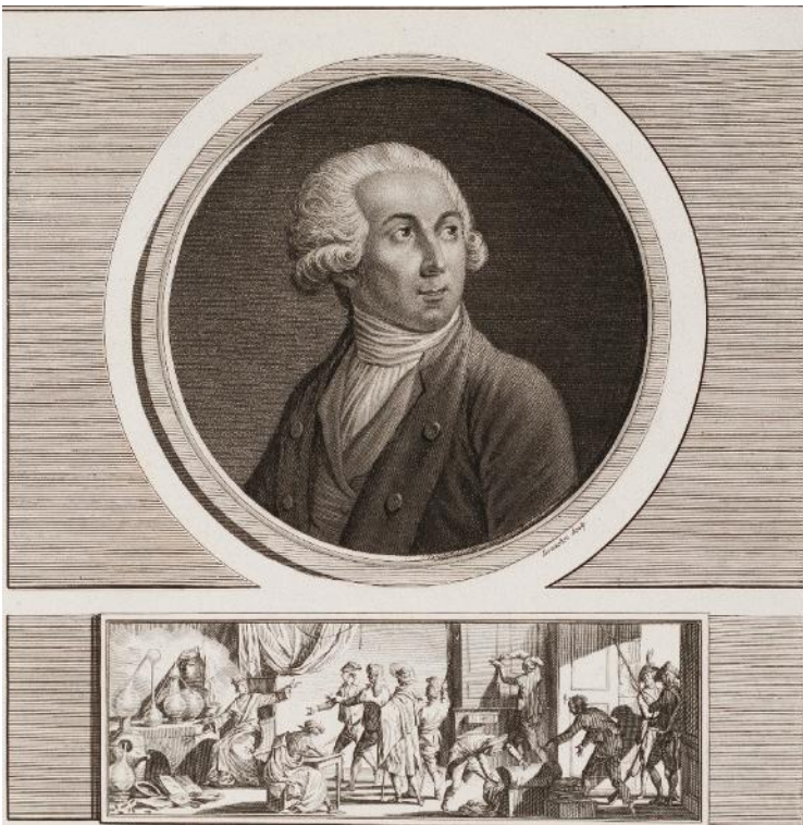
Portret en laboratorium van Antoine-Laurent Lavoisier ..., 18 e eeuw, gravure, Domaine de Seneffe ASBL

Van de Aarde tot de sterren, van meetinstrumenten tot experimenten met elektriciteit, het wetenschappelijk universum van de loges verenigde cartografen, astronomen, dokters, chemici, wiskundigen en kunstenaars, die zich allen engageerden voor eenzelfde onderneming: de wereld begrijpen om hem beter te kunnen “opbouwen” en hem te ‘verheffen”. (M.H )