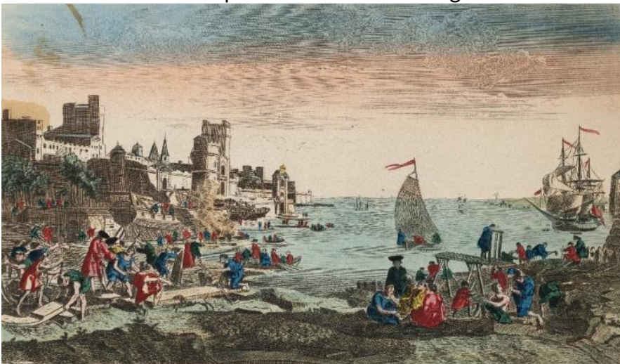
Port et chantiers du Havre, 18 e eeuw, ingekleurde gravure, Domaine de Seneffe ASBL

Die mannen — soms avonturiers, soms geleerden, soms bedriegers — belichaamden een wereld in beweging, waarin de circulatie van ideeën onlosmakelijk verbonden was met de circulatie van individuen. Bovendien groeide reizen uit tot een soort bestaansvorm: dit werd een uitdrukking van een verlangen naar vrijheid, ontdekking, en, dieperliggender nog, een drang om maatschappelijke ideeën die het Europa van de Verlichting met zich meebracht met elkaar te verbinden.