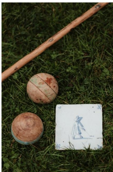
Mosman W., The MacDonald boys playing golf , 18 e eeuw, en Delftse tegel, 18 e eeuw