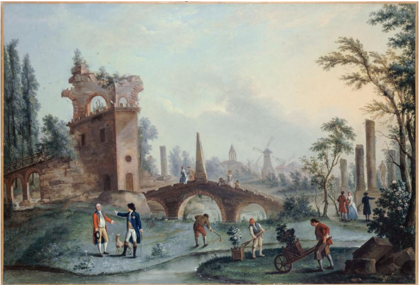
Carmontelle, Uitzicht op de tuinen van Monceau, rond 1778, Musée Carnavalet - Histoire de Paris

In de Verlichting werd de tuin een weerspiegeling van een ideaal dat architecturale rariteiten koppelde aan initiatieke parcours. Intellectuelen en geïnformeerde aristocraten – vaak vrijmetselaars – bezielde deze tuinen met een nieuwe manier van denken, die werd gevoed door lectuur, reizen en een symbolische verbeeldingswereld. De bouwwerken – ruïnes, tempels, piramiden, bruggen, obelisksen – dialogueerden met elkaar rond de vier elementen, terwijl de rotsen, grotten en kunstmatige rivieren een verrijking betekenden van een landschap dat met mysterie en betekenis was beladen. . (M.H )