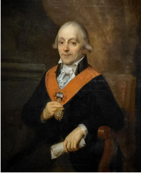
Pfeiffer F.-J., Portret van de Eerbiedwarig Meester-Passenaud P.-P.-S- van de Loge « Les Amis Philanthropes » van Brussel, 19 e eeuw, olieverf op doek, de Loge « Les Amis Philanthropes », Brussel © « Les Amis Philanthropes ».

De vrijmetselarij berust op rituelen waarbij de decoraties die in de loge worden binnengebracht een centrale rol spelen. Elke vrijmetselaar draagt de “accessoires” die overeenkomen met zijn graad: het schootsvel van leerling, gezelschap of meester, soms ook samen met symbolische juwelen. De hoge graden beschikken over meer uitgewerkte decoraties. Die elementen zijn meer dan gewone versieringen. Ze illustreren het inwijdingstraject van elk individu, van de voorbereiding van de kandidaat tot aan de verheffing tot de hoogste graden.