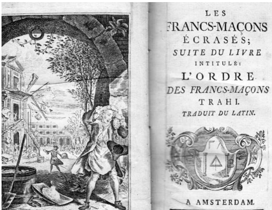
Abbé Larudan, Les francs-maçons écrasés , suite de, L'ordre des francs-maçons trahis , 1747, s.n. éd., Amsterdam, Belgisch museum voor de vrijmetselarij, Brussel © Belgisch museum voor de vrijmetselarij.

De vrijmetselarij, die edelen, geleerden, ambachtslieden en soms geestelijken samenbracht, bevorderde de rede, kennis en respect voor geloofsovertuigingen. De katholieke kerk veroordeelde haar uit vrees voor het geloof, hoewel sommige van haar leden, zoals de prins-bisschop van Luik, François-Charles de Velbrück, de idealen ervan deelden.