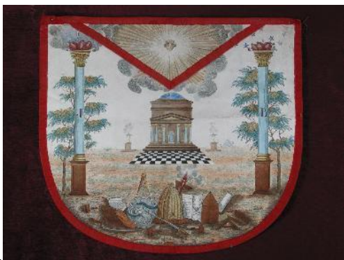
Schootsvel met vrijmetselaarsmotief (Meester), 18 e eeuw, zijde, Belgisch museum voor de vrijmetselarij, Brussel © Belgisch museum voor de vrijmetselarij.

De vrijmetselarij berust op rituelen waarbij de decoraties die in de loge worden binnengebracht een centrale rol spelen. Elke vrijmetselaar draagt de “accessoires” die overeenkomen met zijn graad: het schootsvel van leerling, gezelschap of meester, soms ook samen met symbolische juwelen. De hoge graden beschikken over meer uitgewerkte decoraties. Die elementen zijn meer dan gewone versieringen. Ze illustreren het inwijdingstraject van elk individu, van de voorbereiding van de kandidaat tot aan de verheffing tot de hoogste graden.