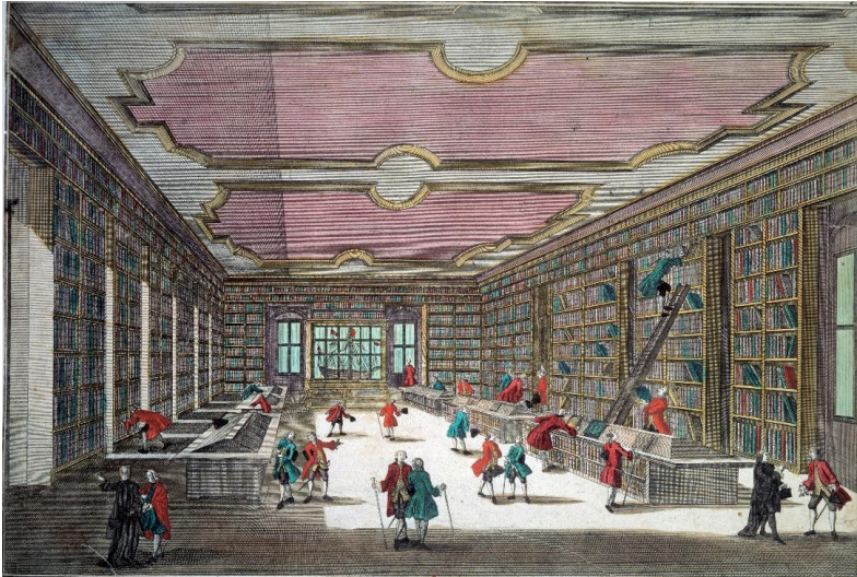
Binnenaanzicht van de bibliotheek van Göttingen, 18 e eeuw

De maçonnieke literatuur van de Verlichting heeft veel te danken aan de boekdrukkunst, die een essentiële rol heeft gespeeld in de verspreiding van de idealen van de vrijmetselaars, zoals sociale rechtvaardigheid, vriendschap en emancipatie. Romans, essays, fictie en toneelstukken van de hand van vrijmetselaars of auteurs die dicht bij die kringen aanleunden, konden een veel ruimer publiek bereiken, reflectie stimuleren en de geest verlichten. Die verspreiding hing samen met een ruimere dynamiek van culturele mobiliteit — bibliotheken, musea, theaters — die de toegang tot weten en kennis bevorderde, en eraan bijdroeg om de maçonnieke waarden ook buiten de loges te laten circuleren