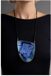
COSMOS, Met 1 , Collier, 2021 - Photographie : Ilya Bernatski, bstudio.photo- Modèle et maquillage : Yuliia Korolova