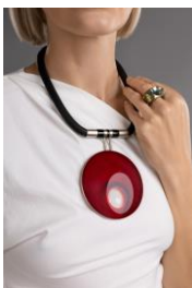
TRANSPARENCE, Elip, Collier, 2016 - Photographie : Ilya Bernatski, bstudio.photo- Modèle et maquillage : Yuliia Korolova