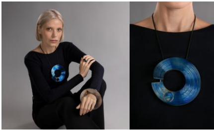
COSMOS, Lab 1 , Collier, 2019 Modèle et maquillage : Yuliia Korolova