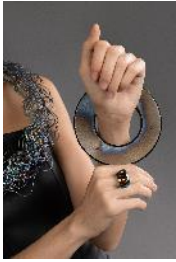
TIO, Delta, Bracelet, 1989 et DO 2 , Bague, 2018--Photographie : Ilya Bernatski, bstudio.photo- Modèle et maquillage : Yuliia Korolova