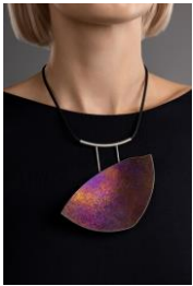
COSMOS, Gi, Collier, 2019 - Photographie : Ilya Bernatski, bstudio.photo- Modèle et maquillage : Yuliia Korolova