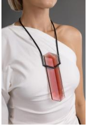
TRANSPARENCE, Pris, Collier, 2023 - Photographie : Ilya Bernatski, bstudio.photo- Modèle et maquillage : Yuliia Korolova