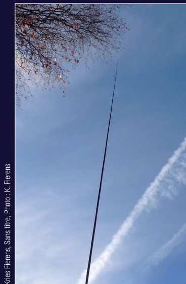
Kris Fierens, Sans titre, Photo : K. Fierens

Zijn watertraject: Het water hangt in de lucht