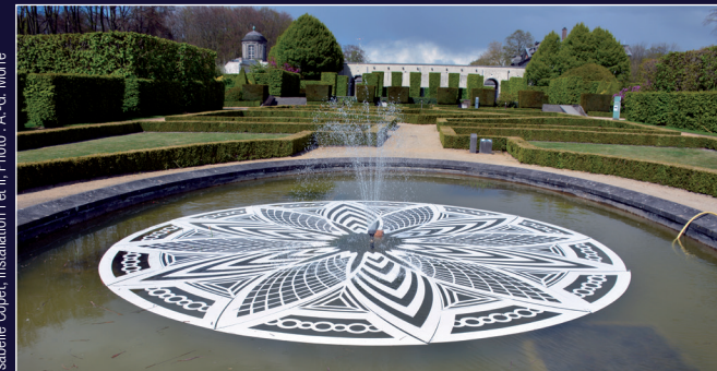
Isabelle Copet, Installation I et II, Photo : A.-G. More

Isabelle Copet crée avant tout un moment de calme, comme une pause dans le temps et l'espace, un instant de légèreté, de poésie.