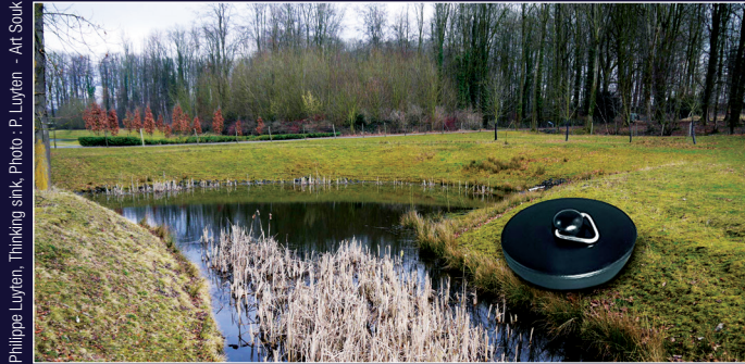
Philippe Luyten, Thinking sink, Photo : P. Luyten - Art Souk

Son parcours d'eau : L'eau coule, s'écoule... Vitale, essentielle. Inépuisable ?