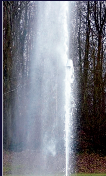
Benoît Félix, Moucher la fontaine, Photo extraite vidéo de B. Félix