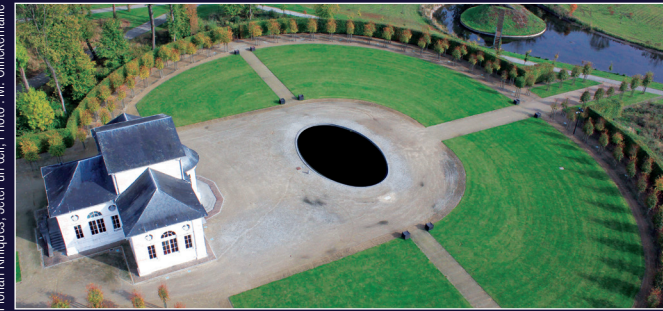
Florian Kiniques, Jeter un œil, Photo : M. Clinkemalle