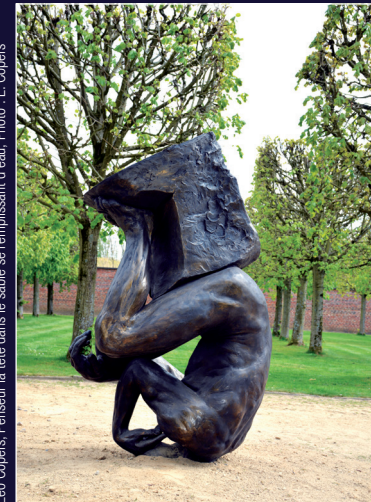
Leo Copers, Penseur la tête dans le sable se remplissant d'eau, Photo : L. Copers

Son Travail : Il travaille avec tous les moyens.