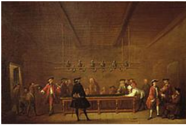
La Partie de billard, par Jean-Baptiste Chardin