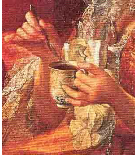
Jean-Baptiste Charpentier le Vieux, La famille du duc de Penthièvre en 1768, dit La Tasse de chocolat : détail, Château de Versailles et de Trianon, Versailles, © Direction des Musées de France, 1986 © Gérard Blot ; Réunion des musées nationaux