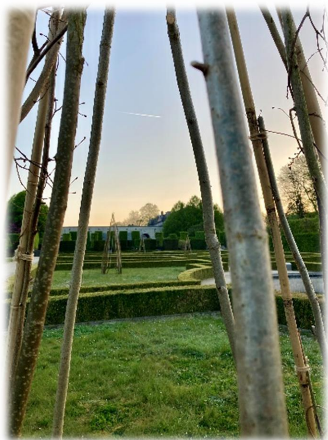
© Les dialogues, Photo E. Briat

Platon affirme que l'Univers a été créé par le Démonstrateur à partir de l'âme du monde, à l'aide de quatre corps de base : la Terre, le Feu, l'Air et l'Eau. L'octaèdre symbolise pour lui l'air.