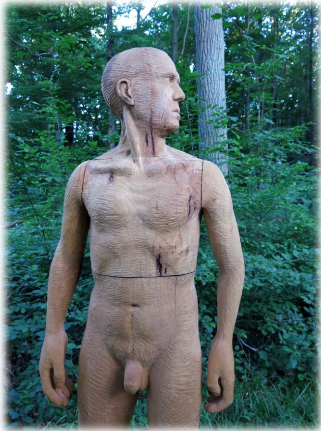
© Qui-Vive, Photo C. Griffon du Bellay

Qui-vive est une sculpture d'homme debout, en pied. Il se dresse, vertical, bien ancré au sol. Solide. Seule sa tête est tournée de côté. Il est aux aguets, tendu, attentif. La sculpture est réalisée en taille directe de bois, à partir de morceaux de troncs de tilleul assemblés. Je travaille principalement à la main, à la gouge et à la massette. Les coups de gouge restent apparents, ils donnent un rythme, une vivacité.