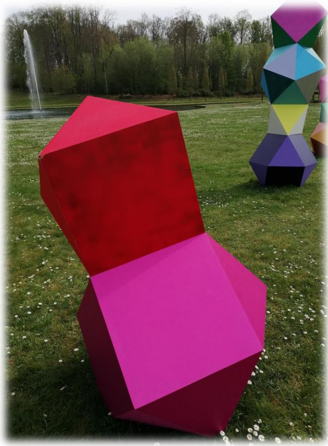
© Pièces Montées, Photo Domaine de Seneffe P. Dewames

Pièces Montées est un assemblage de modules géométriques en bois coloré. Cette installation est née de la digression d'idées. Elle emprunte son nom à la pâtisserie qui clôture le repas d'un mariage.